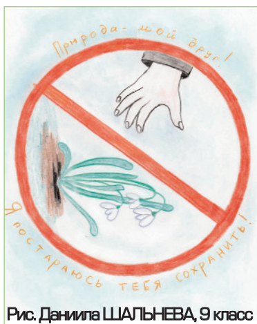
Рис. Даниила ШАЛЬНЕВА, 9 класс

ности по отношению к ней, что природа – наш дом, в котором нужно сохранять чистоту и порядок!